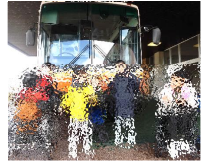
【昭和40年 初代きぼう号】