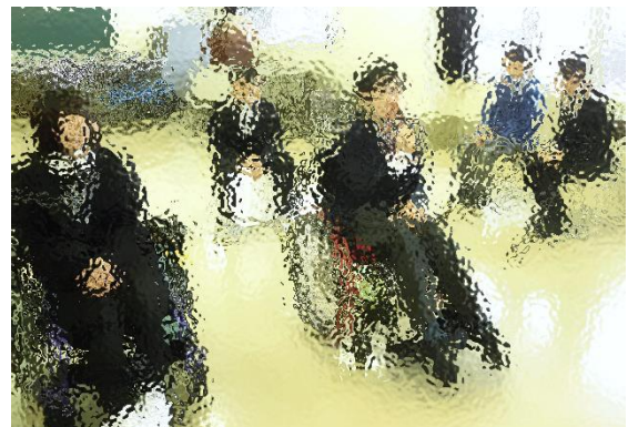
▲生徒会新三役任命式(高等部)

令和5年度生徒会役員の皆さん、1年間ありがとうございました。みんなで協力し合いながら、立派に生徒会を運営しました。