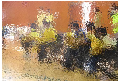
▲写真は令和4年度ポプラ祭の様子

★各学部・グループによってプログラムが異なりますので、詳しくは「ポプラ祭のご案内」をご確認ください。