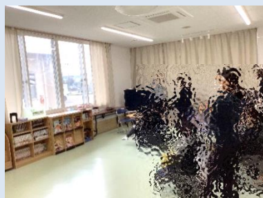
【児童生徒の見学の様子】

寄宿舎でスマート生活体験見学会を行いました。児童生徒が自分で家電を操作して“自分でできる”体験をしました。保護者や福祉施設の方からは、IoT機器の使い方の工夫などの相談もありました。