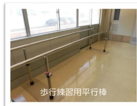
歩行練習用平行棒