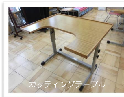
カッティングテーブル