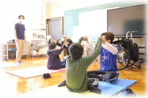
グループセッション