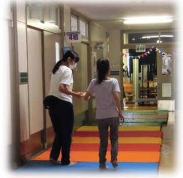
マットを使って歩行練習