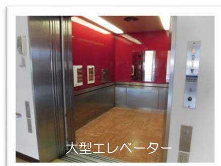
大型エレベーター