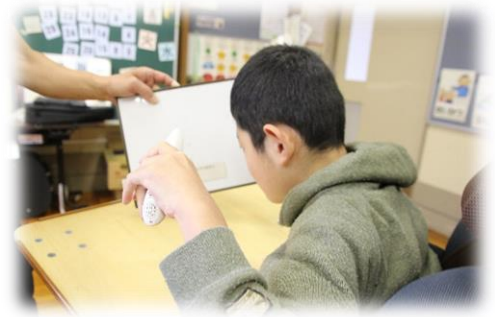
音声を再生するペンを使って司会