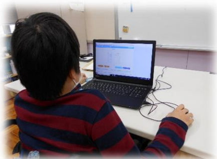
PC を使って文字入力