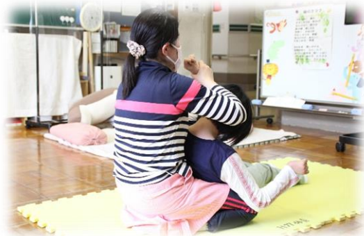
マットの上で体伸ばし