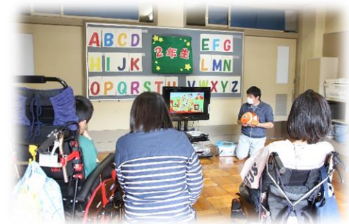
アルファベットの学習