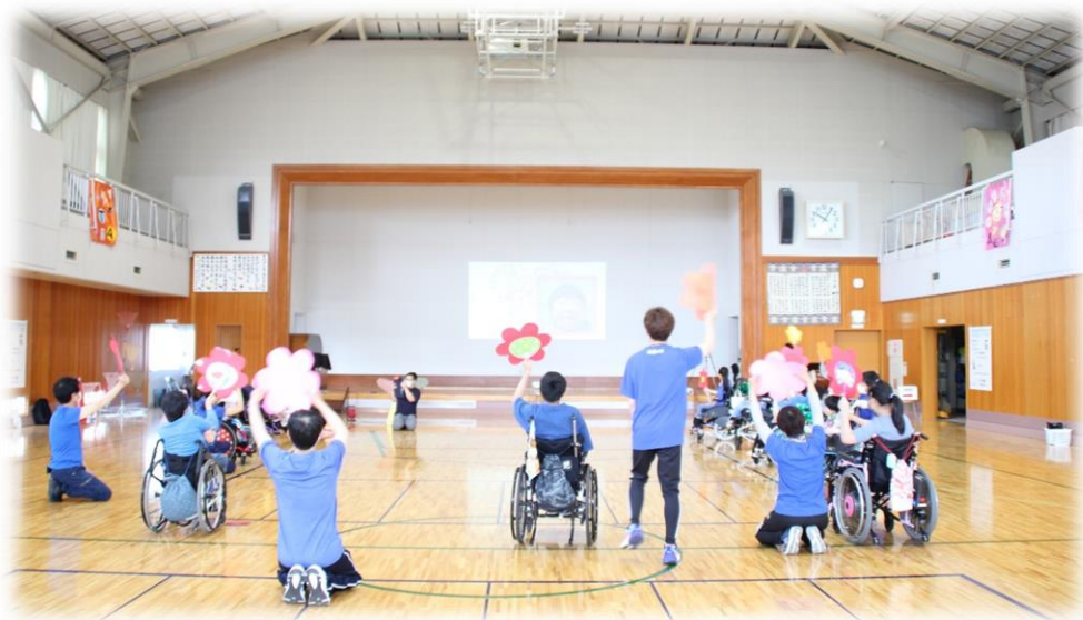
学部での行事：ポプラ祭