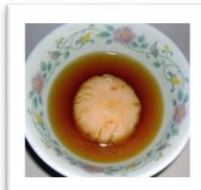
海老フライ→ 海老ボール