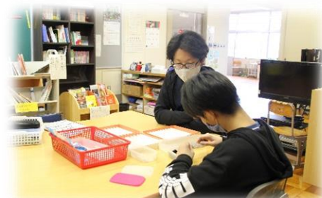
個別の学習：職業家庭