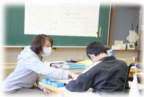
英語テキストを用いた学習