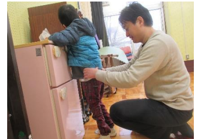
正しい立位姿勢の確認

健康の保持や人との関わりを広げる自立活動を中心に学習に取り組みます。また、実態に応じて音楽、美術、体育等の基礎的な教科学習を組み合わせる学習を進めます。