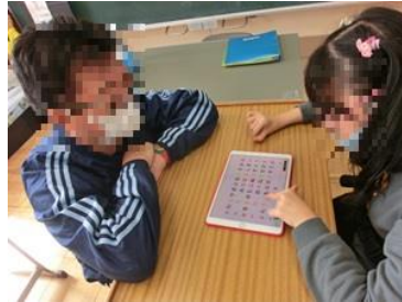
タブレットを使ったコミュニケーション

④グループは生活自立を目指して、知的障害用の各教科の内容や音楽、美術、保健体育などの教科学習を行います。⑤⑥グループは、義務教育段階の各教科の内容を中心に学習します。また、卒業後の職業生活に向けた実践的な学習も組み合わせる学習を進めます。