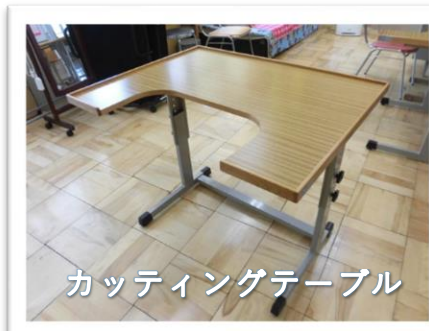
カッティングテーブル