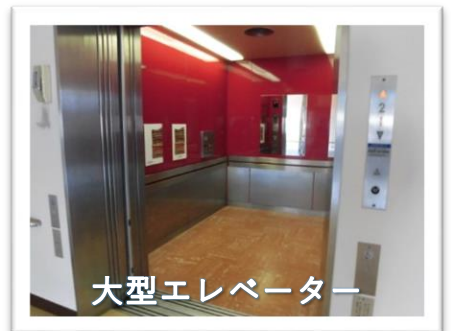
大型エレベーター