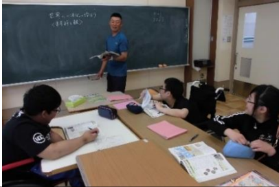
社会科授業「世界史 A」

高等学校卒業が認定される単位を習得できる教育課程です。高等学校の教科学習を計画的に進め、定期テスト等により単位の認定を行います。また、選択教科により進路希望や生徒の実態に応じて学習を進めます。