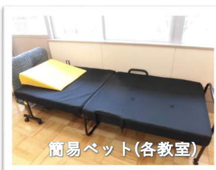
簡易ベット(各教室)