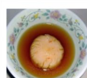
海老フライ→海老ボール