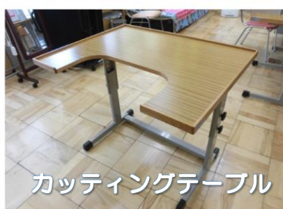
カッティングテーブル