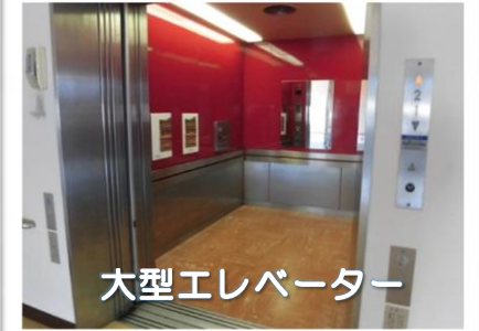
大型エレベーター