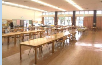
Lunch hall 食堂

明るく広々とした食堂でみんなと食べる食事は、栄養バランス抜群で美味しいこと間違いなしです。