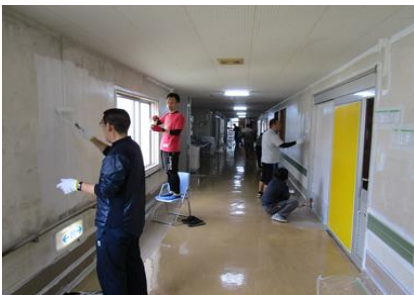
○寄宿舎の整備・美化