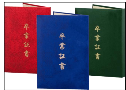
○卒業証書フォルダ贈呈